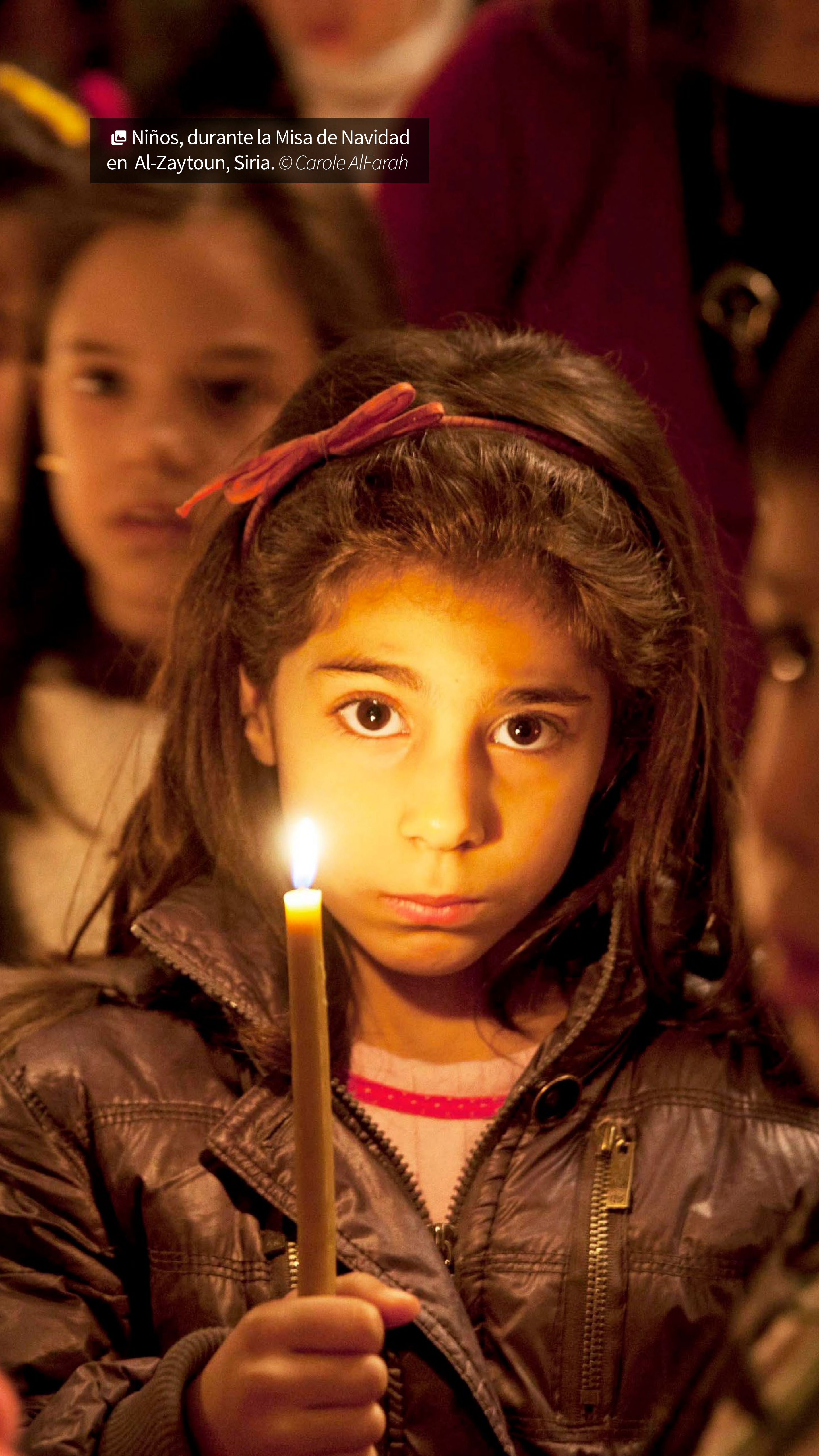
📷 Niños, durante la Misa de Navidad en Al-Zaytoun, Siria.