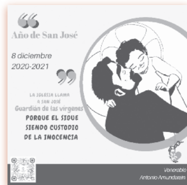
Campanilla del Maestro. Hoja mensual. Marzo 1941