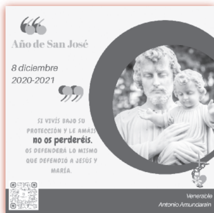
Festividad de San José, 1954

En esta Revista extraeremos los textos más significativos.